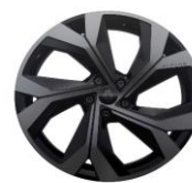
design esprit Alpin daytona