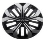
design altao - extended grip