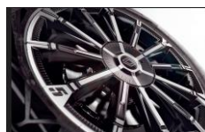
chrono E4 (standard) E3 (optiune)