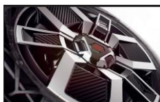
Jante 18" techno